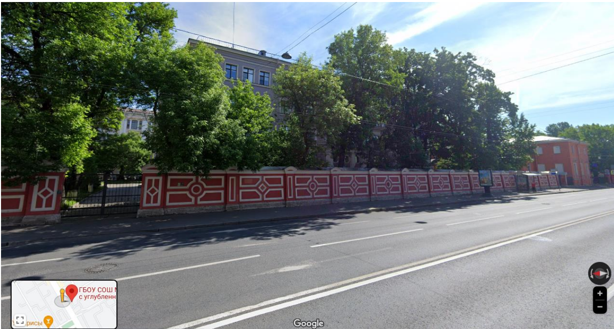
ГБОУ СОШ №35 остановка общественного транспорта «Линия и Кадетская линия В.О/ Большой пр. В.О.»: